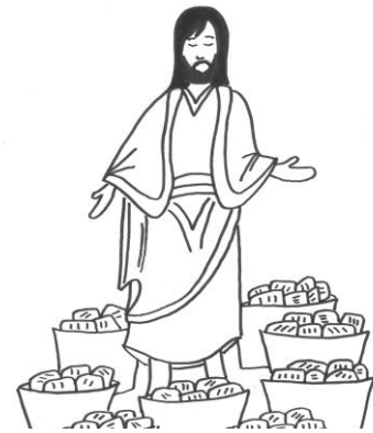
La multiplication des pains :