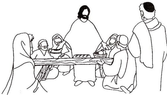
Le repas avec les pécheurs :

Lis puis écris la référence biblique correspondant au texte de la page précédente (activité 3 – les repas dans la Bible 1/2).