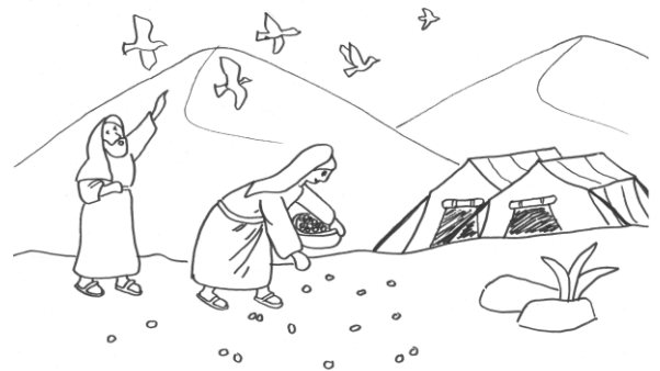
La manne dans le désert :