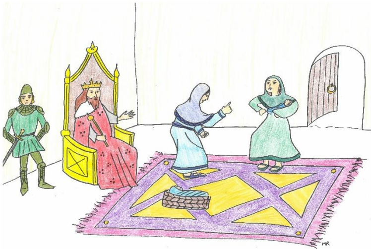
Un jour, deux femmes viennent voir Salomon. Elles se regardent avec colère

Les Livres des Rois couvrent une longue période de l'histoire d'Israël. Malgré un début glorieux (construction du temple de Jérusalem et renommée de sagesse), le roi Salomon se laisse gagner par de mauvaises attitudes. Le royaume se divise en deux parts : Israël et Juda, et les interventions des hommes de Dieu (Elie et Élisée) n'arrivent pas à arrêter la décadence et c'est l'Exil.